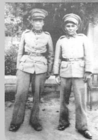
Parada en Melipilla, año 1903