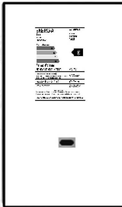
Figura 1 - Ubicación de la etiqueta de eficiencia energética

La etiqueta se debe fijar en el aparato, en su parte frontal o lateral, excepto para modelos cuyas configuraciones hagan impracticable su aplicación en este lugar; en esos casos, se puede aplicar la etiqueta en otro lugar a criterio del fabricante, de forma que sea visible para el consumidor.