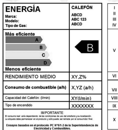
Figura 3 - Etiqueta de Eficiencia Energética: campos y letras.

Los campos de la etiqueta se indican en Figura 3 y se especifican en Tabla 4 siguiente: