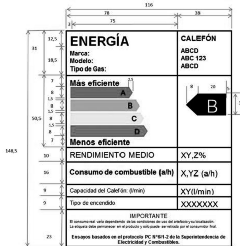
Figura 2 - Etiqueta en colores para declarar Eficiencia Energética de calefones.

Las dimensiones de la etiqueta están expresadas en milímetros (mm) y deben corresponder a las indicadas en la Figura 2 y en tabla 2.